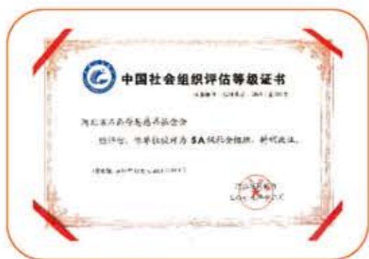
社会组织登记评估证书