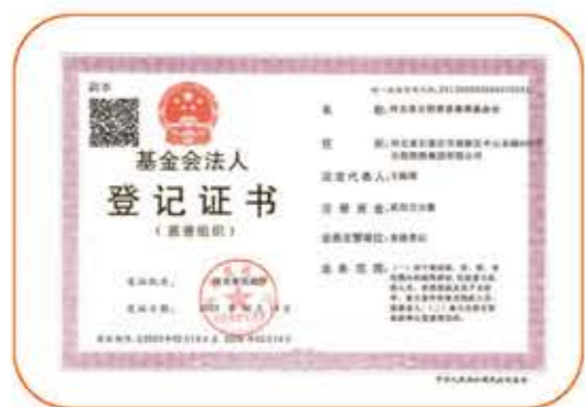
基金会法人登记证